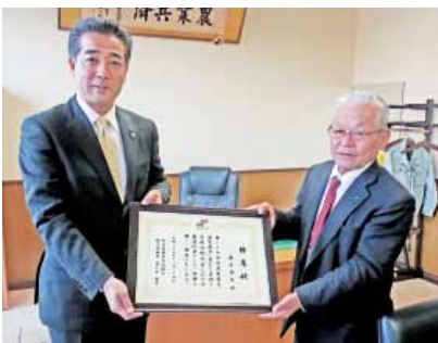
▶熊本県農業共済組合より推薦状の授与