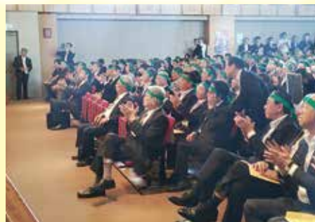
自民党農政緊急決起大会(5月21日)