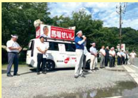
熊本県内で自民党候補を応援 (7月15日)