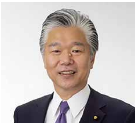
▲3期目の当選を果たした馬場成志氏