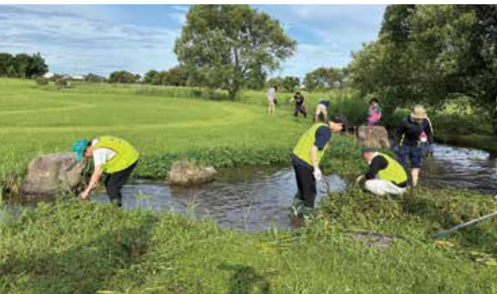
▲除草作業にあたる新入職員ら