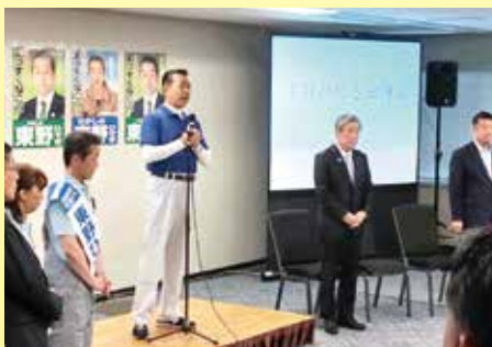
都内で東野ひでき氏出陣式(7月3日)