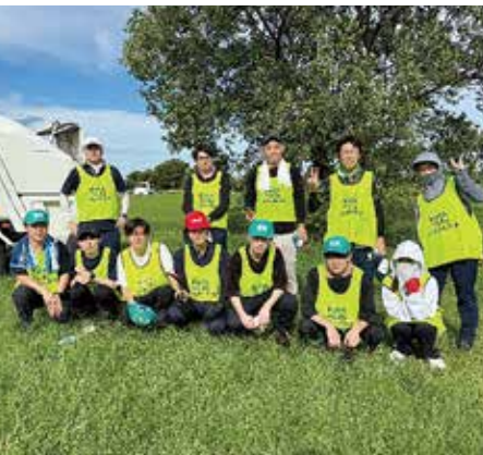
▲作業終了後の集合写真

経済連は、今後も地域と連携しながら、持続可能な農業と豊かな自然環境の実現に取り組む方針です。