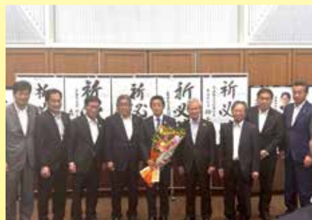
都内で東野ひでき氏の当選を祝福 (7月20日)