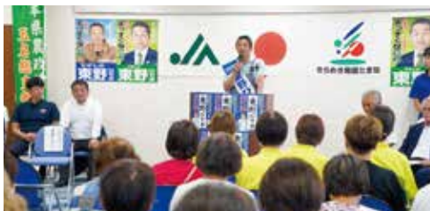
▲演説をする東野ひでき氏

演説後には、一人ひとりと握手を交わし、生産者やJAらが一体となり支援拡大に取り組むことを確認しました。