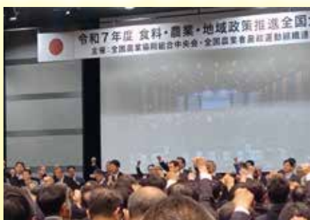
JAグループ農政集会(5月13日)