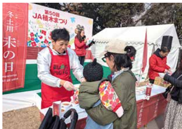
▲トマトみそ汁を受取る親子