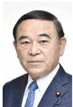
▲第3区 坂本 哲志(75才) 当選9回

高齢化、人口減少、そして担い手不足、物価高、人出不足、さらには渋滞あるいは環境問題への心配など、皆さんの想いをしっかりと受け止めて、丁寧なきめ細かく、着実に解決に向けて全力で政治にまい進していく。