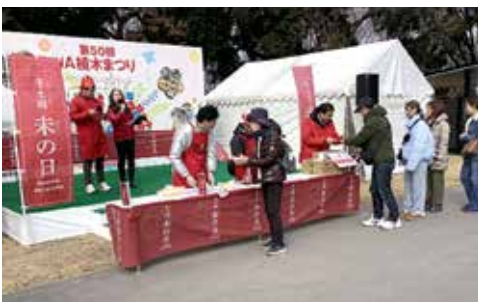
▲振る舞いにできた行列