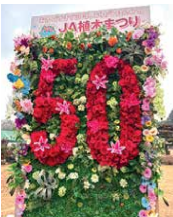
▲50回を記念したモニュメント

や祝日にはさまざまなイベントを実施し、たくさんの方の来場者であふれ、大盛況のうちに終了しました。ご来場ありがとうございました。