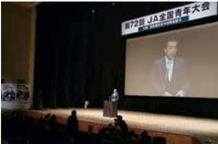
▲2月18日 JA全国青年大会で挨拶

私は、「私の国会議員としての最大の想いは、皆さん青年農業者が20年30年と営農が継続でき、次世代に引き継ぐこと、まさに再生産可能な農業を実現すること」です。そのために全力で取り組みます。皆さんもしっかりと地域で奮闘してください。挨拶させていただきます。