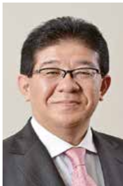
▲第4区 金子 恭之(65才) 当選10回

地域の繁栄なくして国の繁栄無し。被災地であるということも考えながら、国民がそして熊本4区の皆さん方が安心して、快適な生活が送れるように、さらに精進して頑張っていく。責任の重み、期待の大きさも踏まえ、皆さんの代表として国会のど真ん中で頑張っていく。