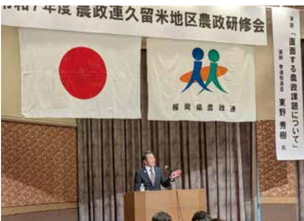
▲福岡県農政連で国政報告を行いました

私からは直近の衆議院議員総選挙や農政課題等に触れつつ、国政報告をさせていただきました。質疑応答もあり、現場における課題について教えていただきました。お集まりいただいた皆さんには心より感謝申し上げます。