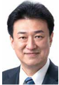
▲第1区 木原 稔(56才) 当選7回

官房長官として地元に戻らずに国を守るという職責を果たすことができました。また、TSMCの会長と話をを行い新たな第2工場での3ナノのロジック半導体の生産を表明されたことを受け、熊本では交通渋滞の問題をはじめ諸問題が発生している。諸課題の解決に向けてチーム熊本で丸となって取り組んでいく。