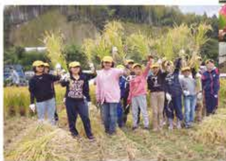
▲自分達で育てた稲を刈る小学生

次世代を担う子どもたちに、食の大切さ・農業の素晴らしさを伝え、農業への魅力を理解してもらう目的として、各支部で上益城管内の小学校児童を対象に食農教育活動を展開しています。各小学校PTAならびに近隣農家の方々などに協力を得て、田植え・稲刈り・水田観察等を青壮年部盟友の指導により行っています。