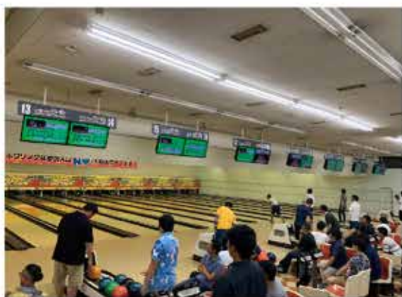
▲本年度開催のボーリング大会の様子

盟友の親睦を図るため、また、JA職員との交流・繋がりを強化するために、スポーツ大会を毎年開催しています。大会はいつも大盛り上がりです。笑顔ありハブランクありの光景が広がります。