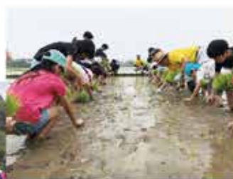
▲食農教育活動の一環として田植えを行う小学生