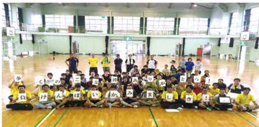
▲熊本地震から復興へのスローガン「負けんばい！かみましき青壮年部！」

3年前の熊本地震で甚大な被害を受けましたが、復興へのスローガンとして「負けんばい！かみましき青壮年部！」を掲げ、全盟友一丸となって事業展開を行っております。