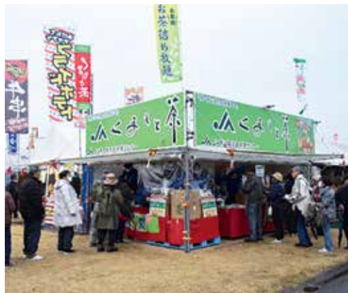
▲大盛況の茶用センターブース