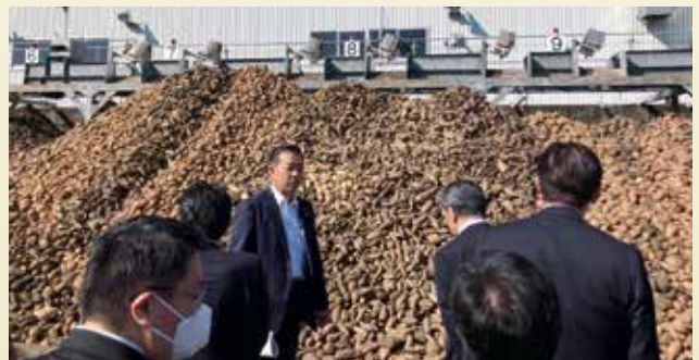
自民党野菜・果樹・畑作物等対策委員長として鹿児島県に甘味資源作物にかかる現地視察に行きました(R7年11月24日)