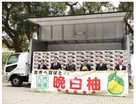
▲香港に向けて晩白柚の出発式を開催

が縁起物として好まれており、行政、工商业者などと連携し、香港や台湾への出荷を長年続けています。