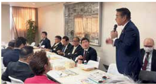
▲12月17日 自民党みどり委員会で意見

私は、「今、米の価格が回復基調で生産者が勢力的に頑張ろうという中で、もう一つ先の有機や環境配慮の取り組みを行うのは、難しい面がある。今後、幅広い生産者が有機や環境配慮の取り組みにつなげていくための手順や方向性を打ち出して欲しい」と意見させていただきました。