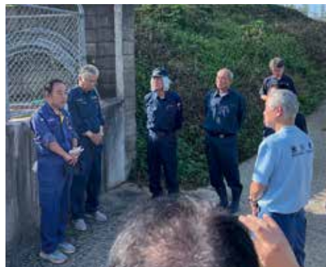
▲国会議員等による被災地視察の様子

要望に取り組みました。国行政等による迅速な対応の成果もあり、営農再開も円滑にできています。