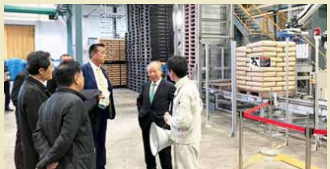
自民党野菜・果樹・畑作物等対策委員長として北海道に甘味資源作物にかかる現地視察に行きました(R7年11月9日)