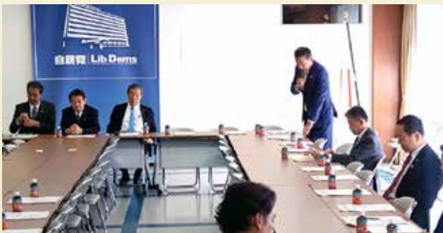
自民党野菜・果樹・畑作物等対策委員長としてゲタ対策の結果報告を行いました(R7年11月26日)