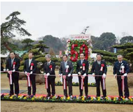
▲開会式でのテープカットの様子

品が当たるスタンプリー、来場者参加型のチャリティーオークションに加え、今年から県内J A直売所と連携し豪華賞品が当たる「熊本のうまかもんキャンペーン」を展開するなど50回の節目にふさわしいイベントも目白押しでした。