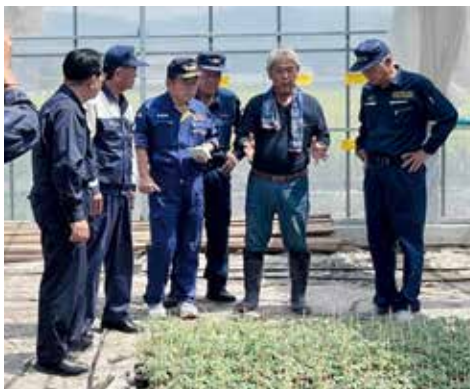
▲国会議員等へトマト苗の掘害状況を説明する生産者