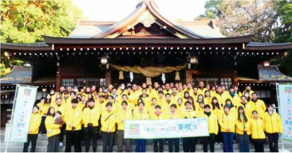
▲水前寺成趣園での清掃活動の様子

J A共済連熊本は、これからも共済事業と地域貢献活動を通じて、地域との絆を強化し、豊かな環境づくりに貢献していきます。