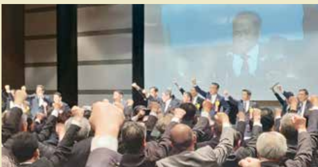
JAグループ基本農政全国大会でガンパロウ三唱を行いました(R7年11月10日)