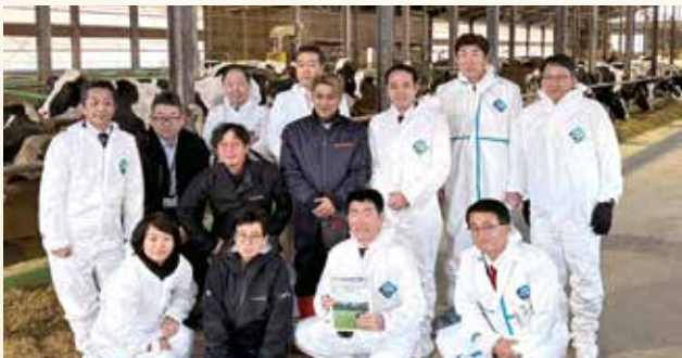
自民党畜産・酪農対策委員会事務局次長として北海道に現地視察に行きました(R7年12月6日)