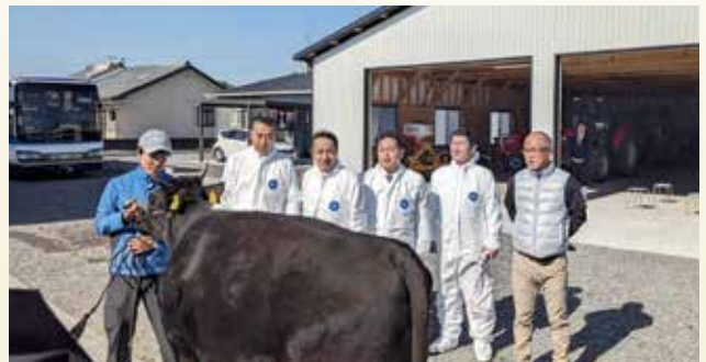
自民党畜産・酪農対策委員会事務局次長として宮崎県に現地視察に行きました(R7年11月29日)