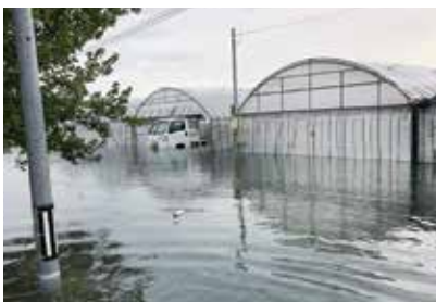
▲8月の豪雨でハウスが冠水

地域農業の早急な復旧と営農再開のため、熊本県選出の国会議員もいち早く現地視察を行い、被害状況を確認、対策に着手されました。当組織においても、行政機関と連携し、補償制度の拡充などの