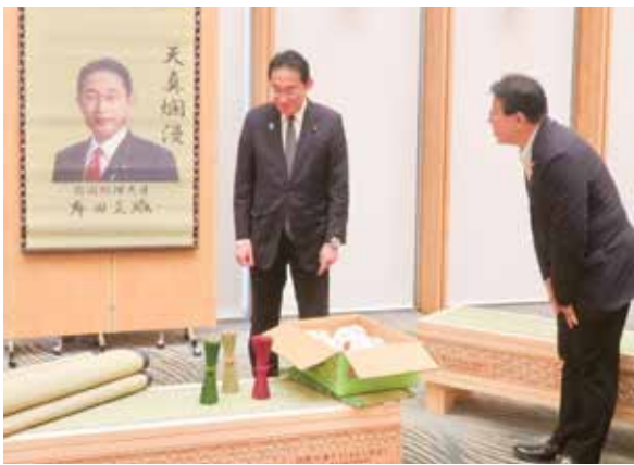
▲岸田文雄首相(当時)へ畳ベンチとタペストリーを贈呈

が縁起物として好まれており、行政、工商业者などと連携し、香港や台湾への出荷を長年続けています。